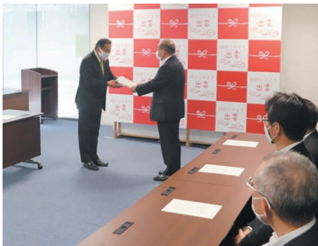
「新型コロナウイルス感染症対策の迅速かつ総合的な取組を求める決議」を議決後、市長へ提出し説明

※自民協議会には、出雲市議会の会派「真誠クラブ」「平成クラブ」「政雲クラブ」の21名が参加しています。