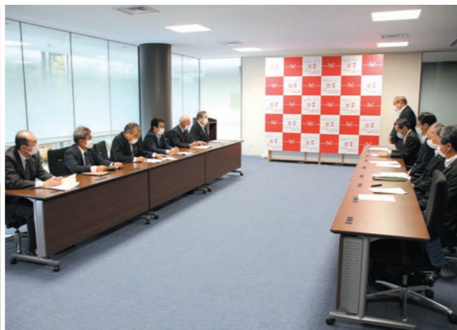
「令和2年度予算に関する緊急提言書」出雲市議会自民協議会で取りまとめ市長へ提出